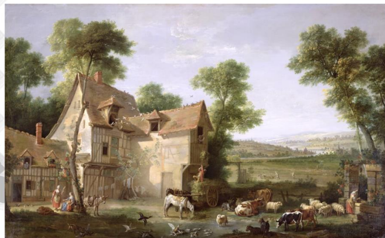
Jean-Baptiste Oudry, La Ferme (musée du Louvre)

Organisé par le laboratoire ALTER (UPPA) et le CELLAM (Université Rennes 2)